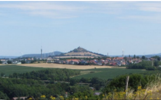
Der Kegel des Desenbergs ist nicht zu übersehen