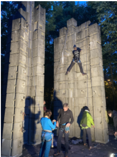
Fluchtcklettern an den Drei-Zinnen im Garten des DAV-Haus.