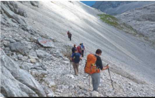
Schuttkar an Leutasch

Hütte auf 1867 m. Lang war der Weg und schon schwer für die Ungeübten. Aber heute ist echtes Hüttenfeeling angesagt: Lager für zwölf Personen, waschen nur kalt über den Hof, aber der Trockenraum funktioniert. Frühstück ist OK und heute wird es alpin.