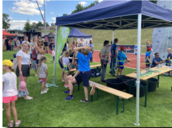
Andrang bei der Anmeldung

und Familiengruppe war es möglich, dass mehr als 200 Kinder, vor allem im Kindergarten- und Grundschulalter, ein Klettererlebnis hatten.