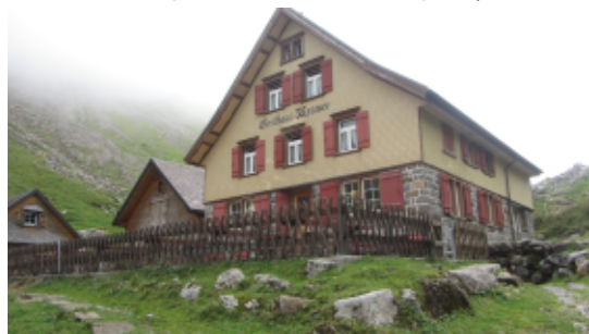
Zweite Übernachtung im Gasthaus Mesmer

Nachdem wir die anspruchsvollen Streckenabschnitte hinter uns gebracht hatten, erreichten wir das recht einsam liegende Gasthaus Mesmer (1602 m). Die Belegung war auch hier – wie beim Berggasthaus Meglisalp – sehr gering; die Saison ist während der Woche ab Mitte August vorbei, nur am Wochenende ist noch reger Betrieb. Auch hier konnte man angenehm übernachten, wenn auch der Komfort ob der etwas älteren Hütte nicht so gut war wie auf der Meglisalp.