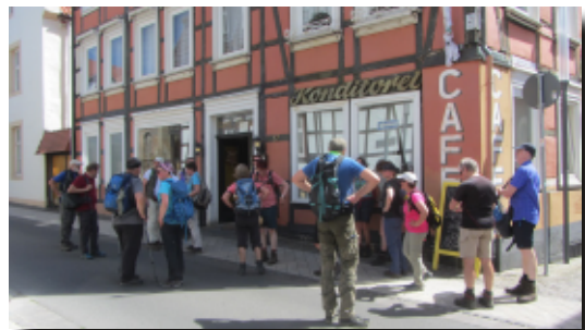
Nach der Wanderung Einkehr ins Cafe Bauer in Warburg