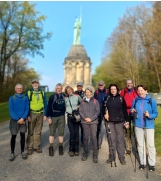
Start der Wanderung am "Hermann"