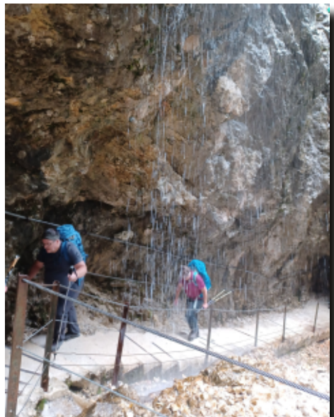
In der Höllentalklamm wird's nass

Bis auf 1000 m runter geht es waldig, begleitet von Almkühen auf schmalen Wegen des Bernadeinsteigs zur Bockhütte. Sie liegt oben an der Partnachklamm. Schmale Felssteige, immer noch schattig, aber es wird steiniger, kletteriger, schwieriger, heißer wieder hoch bis zum Schachenhaus-Schloß und