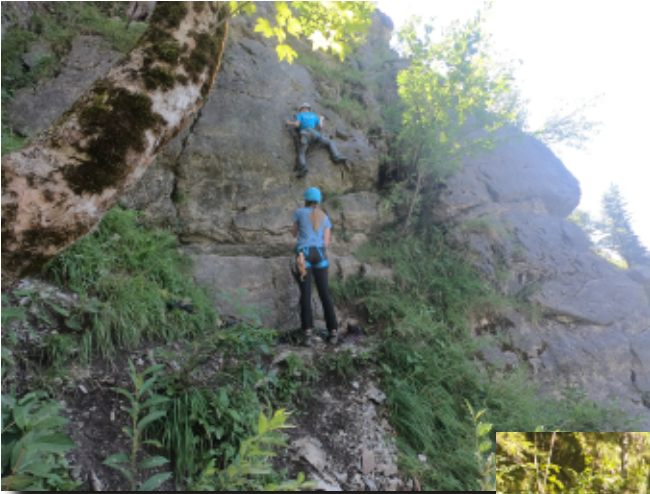
Sportklettern im Klettergarten nahe Oberjoch