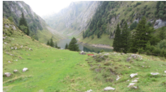
Blick über den Fählensee zum Säntis

Start der ersten Etappe in Brülisau; mit der Seilbahn zum Hohen Kasten (1794 m). Das Wetter war leider sehr nass und die Sicht vom Hohen Kasten sehr begrenzt. Eigentlich sollte hier schon ein schöner Blick ins Rheintal der erste Höhepunkt sein. Auf dem weiteren Weg zum Berggasthaus Staubern (mit Pause) wurde das Wetter leider nicht besser; Erst kurz vor Erreichen des Gasthauses Bollenwees klarte es ein wenig auf und man konnte ins Rheintal schauen. Nach der zweiten Pause zog sich das Ziel Meglisalp dann doch sehr in die Länge. Die Widderalp war zwar noch bewirtschaftet, aber eine Pause konnte man dort nicht mehr machen. Nach