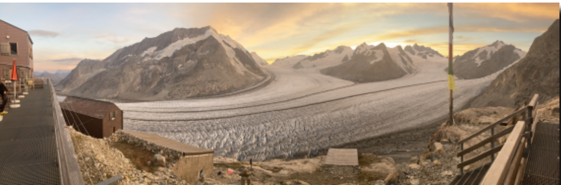
Sonnuntergang über dem Konkordiaplatz, mit der Jungfrau und dem Jungfraujoch (hinterm Fahnenmast)