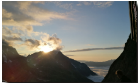
Abends an der Trifthütte

mer für den kommenden Tag erholen konnten, da für den folgenden Tag die Besteigung des 3000er anstand. Nach dem Abendessen und einem grandiosen Sonnenuntergang erklärte Dirk den Teilnehmern, wie eine Route richtig und sicher geplant wird, das Kartenlesen wurde erklärt und welche Zeit man bei entsprechendem Weg und Höhenmetern einrechnen muss. Ebenfalls wurden die Gefahren wie Wetterlage und Fehleinschätzungen besprochen.