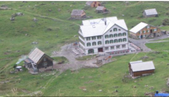
Erste Übernachtung auf der Meglisalp

Unsere zweite Etappe sollte mit dem Aufstieg zum bekannten Berg des Appenzeller