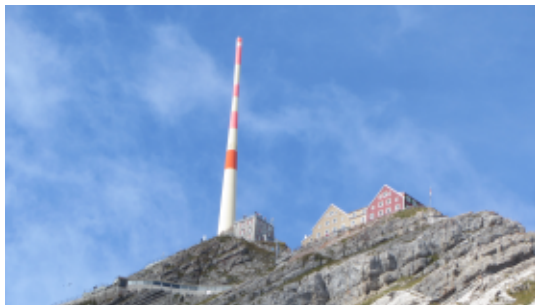
Das Gasthaus "Alter Säntis" unterhalb der Bergspitze

Landes, dem Säntis (2502 m) der Höhepunkt der Tour sein. Das Wetter war super und so konnte uns auch der anstrengende Weg über die Agetplatte (1897 m) und die Wagenlücke (2079 m) nicht die Laune verderben. Nach ca. 5,5 km erreichten wir das Gasthaus „Alter Säntis“, direkt unterhalb der Spitze. Die schöne Aussicht lud zu einer ausgiebigen Pause ein. Eine Stärkung war auch notwendig, denn es stand uns ein anstrengender und nicht ungefährlicher Abstieg über die seilversicherte „Himmelsleiter“ bevor. Zudem war der Gipfel mittlerweile in Wolken