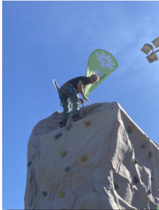
Jochen Kley befestigt die Gipfelfahne