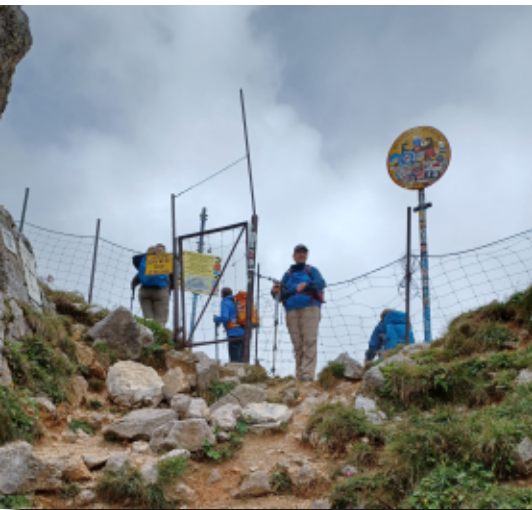
Grenzübergang Österreich / Deutschland

Sonne, schöne Aufstiege, Ausblicke, gute Laune: Es geht hoch bis zur Meilerhütte auf 2583 m am Dreitorspitz-Gatterl, und die österreichische Grenze ist erreicht. Runter nach Leutasch - Schotter, Geröll, Baumwurzeln - und jetzt fehlt einigen von uns die Trittsicherheit und Erfahrung. Aber die Gruppe hält zusammen auf dem VIA ALPINA. Mancher Hosenboden leidet. Die Nerven liegen blank,