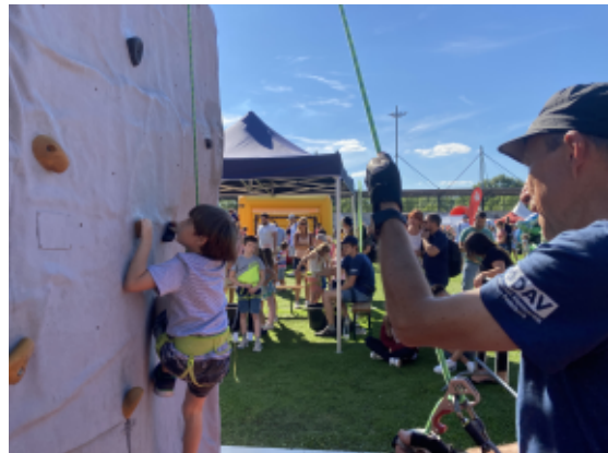
Jetzt heißt es: Die Spitze erklettern!

Bei sonnigen Temperaturen war die schwierige Route durch die schattige Nordwand des „Mount Ahorn“ besonders beliebt. In zahlreichen Gesprächen wurde über die Angebote der Sektion informiert und viele Eltern haben die aktuelle Ausgabe der Sektionsmitteilungen mitgenommen, die Kinder indes freuten