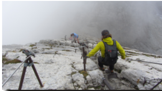
Steiler Abstieg vom Säntis über die "Himmelsleiter"

gehüllt. Es gab Stau auf dem Abstieg, den einige Bergwanderer mit ungeeigneten Schuhen, Hunden und kleinen Kindern absolvierten. Da wundert es nicht, dass immer mehr Bergunfälle passieren.