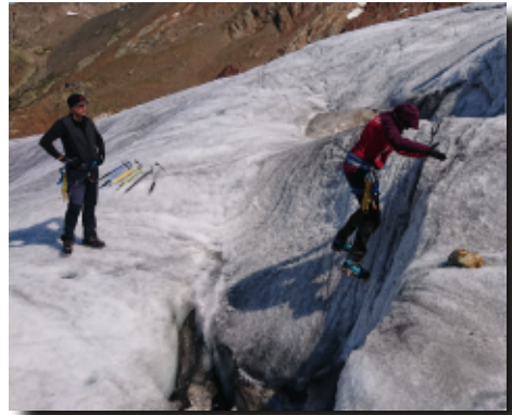
Gehen mit Steigeisen

Am darauffolgenden Tag erfolgten bei bestem Wetter Übungen zur Selbststretzung am Gletscher. Dirk erklärte allen Teilnehmern, wie Eisschrauben sicher und stabil ins Eis geschraubt werden und welche Hilfsmittel im Zweifel zur Verfügung stehen. Ebenfalls wurden die Gefahren am Gletscher besprochen. Am frühen Nachmittag ging es bereits wieder zurück zur Trifthütte, damit sich alle Teilneh-