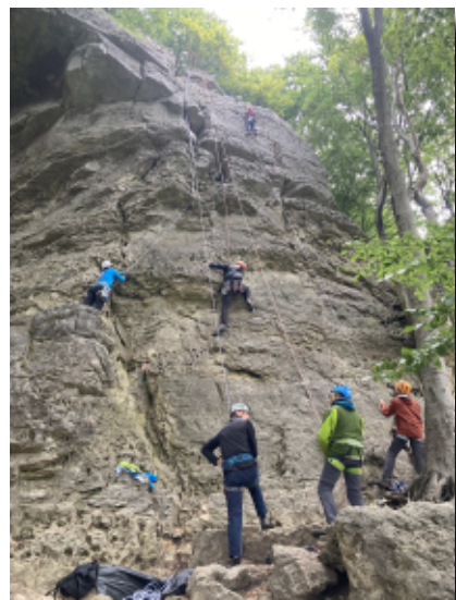
Die Hexenkanzel, einer der Ausbildungsfelsen im Ith, fest in der Hand der Sektion Paderborn.