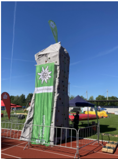
Unser geliehener Outdoor-Kletterfelsen

Coronabedingt fand 2020 kein Ferienfinale statt und auch 2021 gab es lediglich ein Ferienfinale „light“, an dem sich der DAV aus organisatorischen Gründen nicht beteiligen konnte.