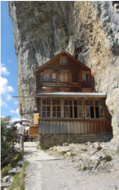
Das Gasthaus Aescher klebt förmlich an der steilen Felswand

Berggasthaus Aescher mit dem berühmten Wildkirchli (1644 m). Der Weg war recht steil - und weil die Sonne kräftig schien - auch recht schweißtreibend. Auch hier kamen uns einige Wanderer mit ungeeignetem Schuhwerk entgegen und so wundert es nicht, dass es in diesem Sommer schon einige Bergunfälle mit fünf Toten gegeben hatte. Eine ausgiebige Pause war auch hier angebracht und wir konnten sie uns leisten, denn es stand uns nur noch ein kurzer Anstieg zur Seilbahn Ebenalp bevor. Das Besichtigen des Wildkirchli sollte man sich nicht entgehen lassen. Nach einem Gang durch eine Höhle erreicht man dann bald die Seilbahn der