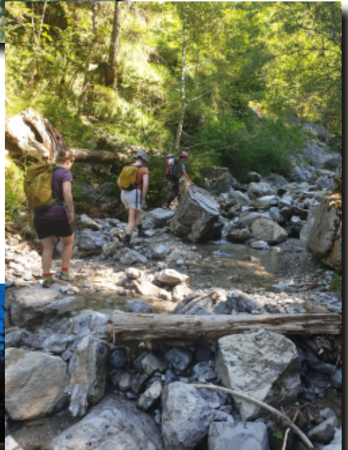
Angenehm kühl! Wasserfalltour zur Gumpede des Schleierwasserfalls