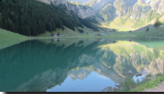
Der Säntis im Spiegel des Seelalpssees

Berggasthaus Aescher mit dem berühmten Wildkirchli (1644 m). Der Weg war recht steil - und weil die Sonne kräftig schien - auch recht schweißtreibend. Auch hier kamen uns einige Wanderer mit ungeeignetem Schuhwerk entgegen und so wundert es nicht, dass es in diesem Sommer schon einige Bergunfälle mit fünf Toten gegeben hatte. Eine ausgiebige Pause war auch hier angebracht und wir konnten sie uns leisten, denn es stand uns nur noch ein kurzer Anstieg zur Seilbahn Ebenalp bevor. Das Besichtigen des Wildkirchli sollte man sich nicht entgehen lassen. Nach einem Gang durch eine Höhle erreicht man dann bald die Seilbahn der