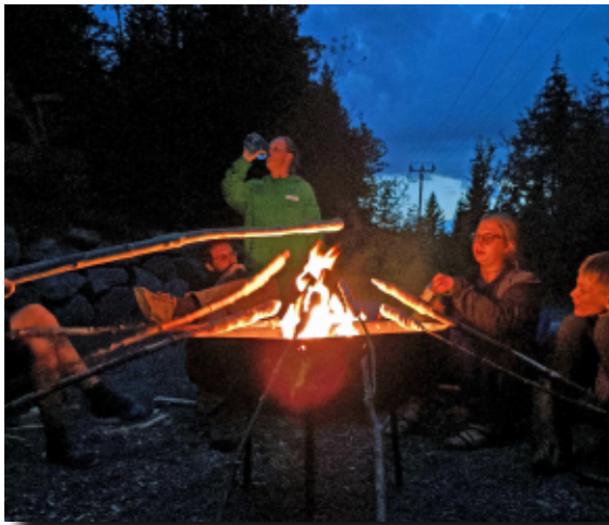
Letzter Abend mit gemeinsamen Abschlusslagerfeuer mit Stockbrot und Marshmallows