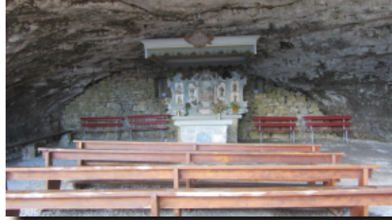
Das Wildkirchli in der Nähe des Gasthauses Aescher

Ebenalp runter nach Wasserauen (868 m). Ab hier kann man dann per Bahn oder Bus in Richtung Brülisau fahren.