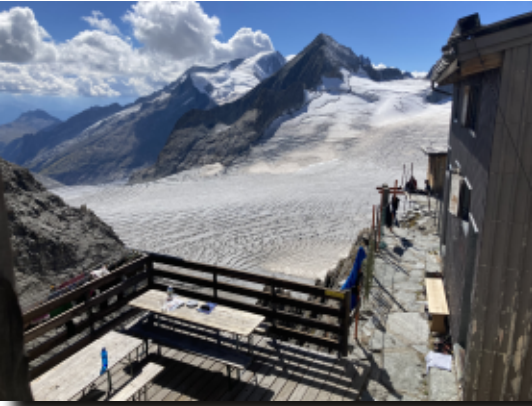
Blick aus dem Lager der Oberaarjochhütte auf den Studergletscher und das Finsteraarhorn

der recht kleinen Hüttenterrasse genießen. Der Ausblick und die Lage waren gigantisch, direkt am Felsen klebt die Hüttenplattform, von dort bot sich ein Bild der Gletscher- und Bergwelten von Südosten (Blick bis in die italienischen Alpen) bis nach Westen (Finsteraarhorngebiet).