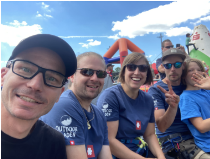
Unser Betreuer-Team am "Kletter-Felsen"