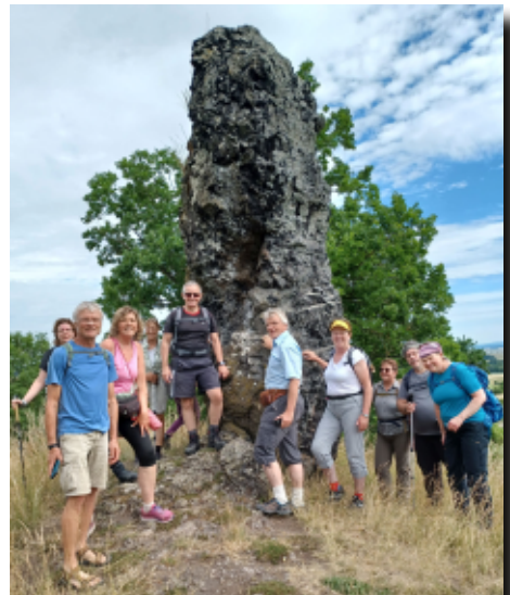
Bei den Koppensteinen