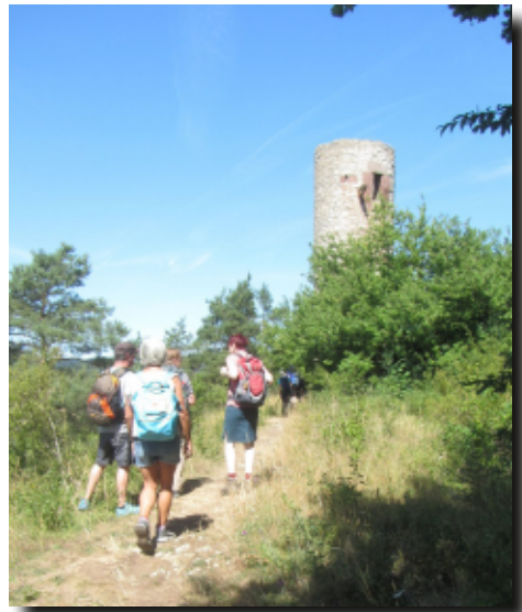
Am Heinturm gab es eine Pause